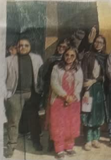
रोहड़ू : एल.बी.एस. कालेज